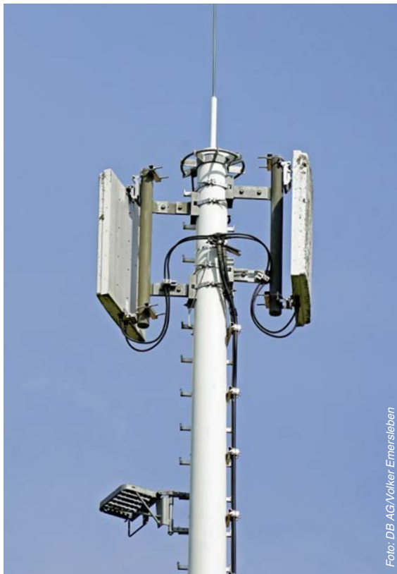
Abbildung 3: GSM-R-Sendemast an einer Bahnstrecke