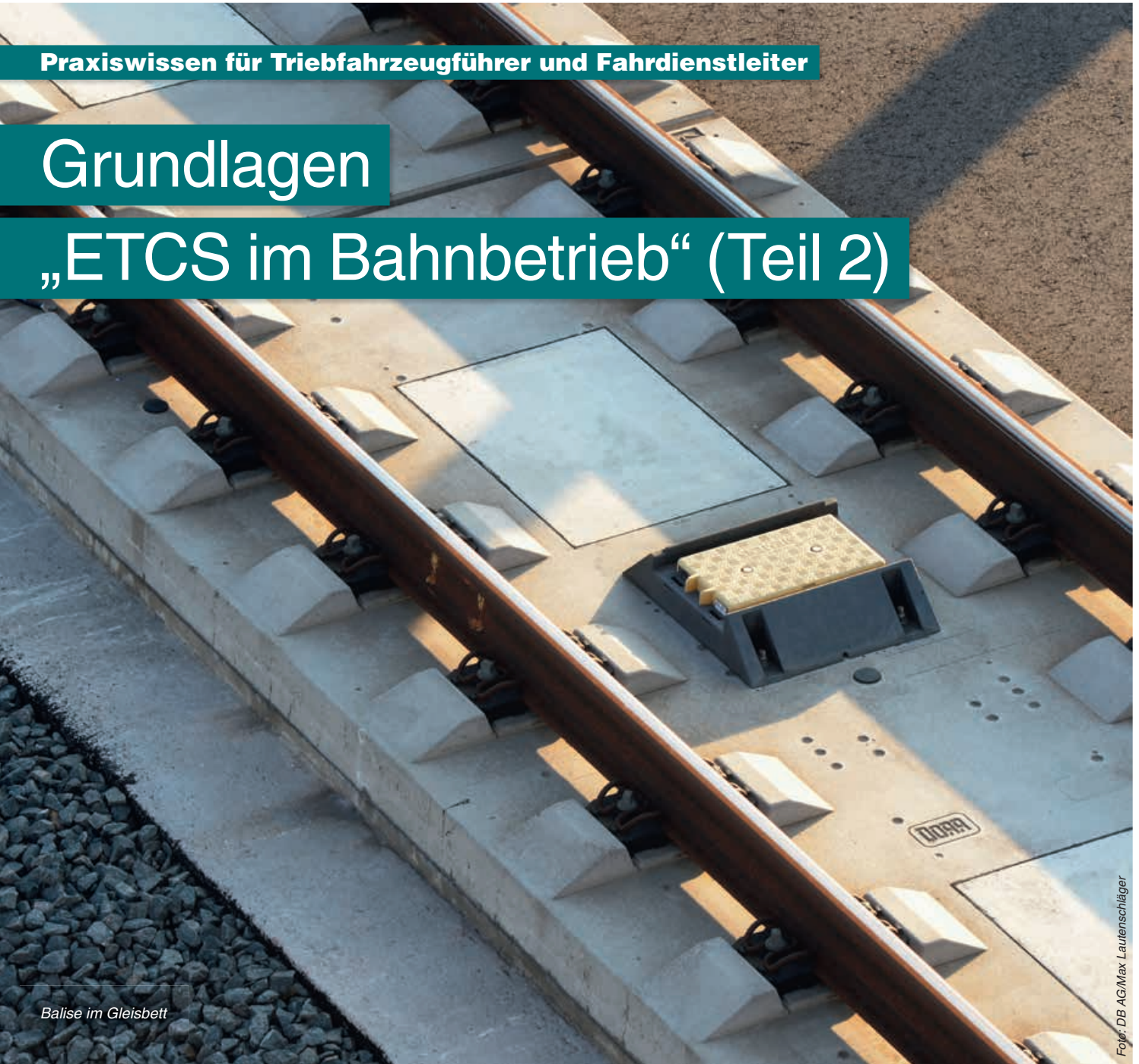
Balise im Gleisbett