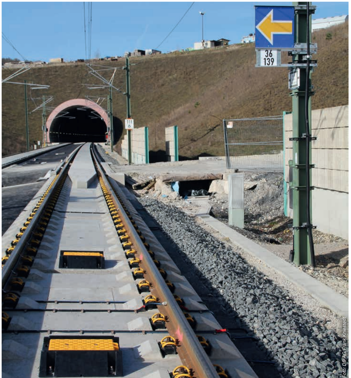
Abbildung 1: Balisen und Signal Ne 14

Zur weiteren streckenseitigen Ausrüstung gehört beim ETCS-Level 2 das (Neben-)Signal Ne 14. Das Signal Ne 14 (Abbildung 1) befindet sich am Standort von Hauptsignalen oder, bei ETCS-Level 2 ohne Lichthauptsignalen, an Standorten von virtuellen Hauptsignalen und schützt den nachfolgenden