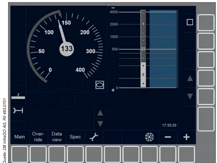
Abbildung 3: Beispiel für ein MFD

Für den Tf ist das MFD der wichtigste Bestandteil der fahrzeugseitigen ETCS-Ausrüstung. Es dient ihm zur Auswahl bzw. zum Eingeben von Daten (bspw. Zugdaten), ferner der Anzeige relevanter