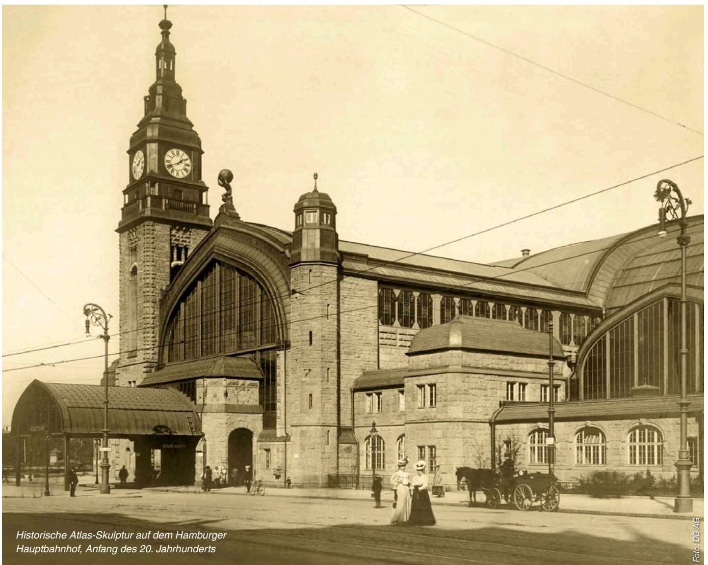
Historische Atlas-Skulptur auf dem Hamburger Hauptbahnhof, Anfang des 20. Jahrhunderts