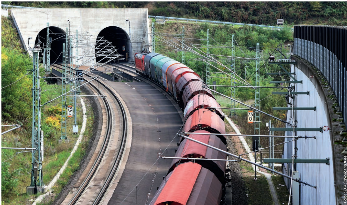
Cargo-Güterzug im Spessart: In der zentralen Netzwerksteu- erung wird der Einzelwa- genverkehr europaweit koordiniert

Kundenservice und Operations Center waren bei DB Cargo bislang zwei getrennte Einheiten. Während die Einheit Kundenservice für die Kommunikation mit den Kunden verantwortlich war und sich um kommerzielle Themen kümmerte, steuerte das Operations Center die Produktion und hatte dabei europaweit sämtliche Züge von DB Cargo im Blick.