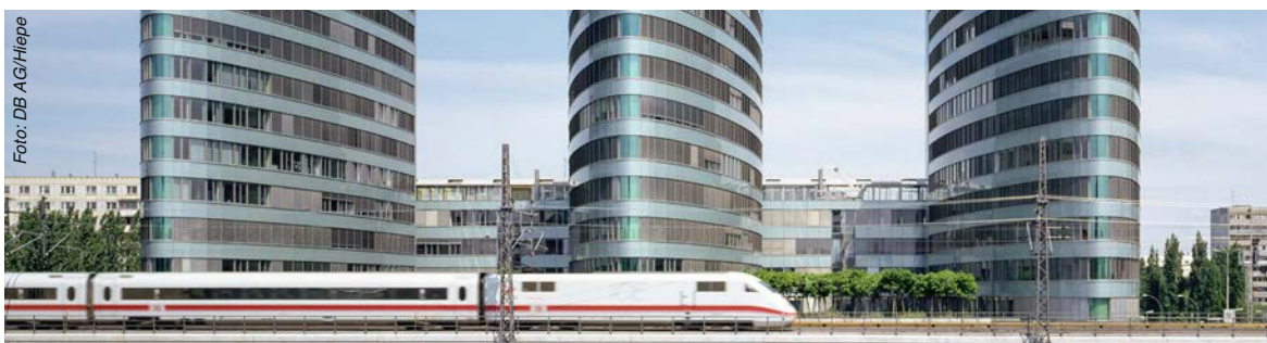
Berlin 1998 – ICE auf der Stadtbahnstrecke zwischen den Bahnhöfen Ostbahnhof und Jannowitzbrücke vor dem Trias-Gebäude (rechts ehemaliger Sitz der Konzernleitung der DB AG)

verwaltete die Bundesrepublik Deutschland unter dem Namen „Deutsche Bundesbahn“ das Bundes-eisenbahnvermögen als nicht rechtsfähiges Sondervermögen des Bundes mit eigener Wirtschafts- und Rechnungsführung.