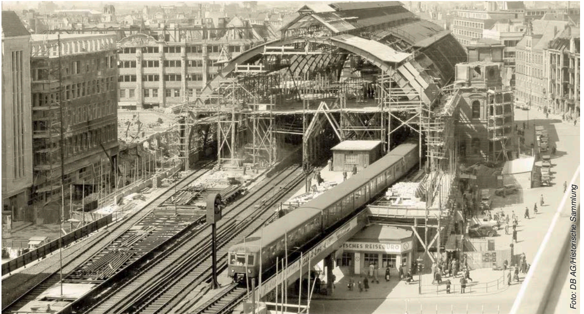
Wiederaufbau des Bahnhofs Berlin-Alexanderplatz im Jahre 1951