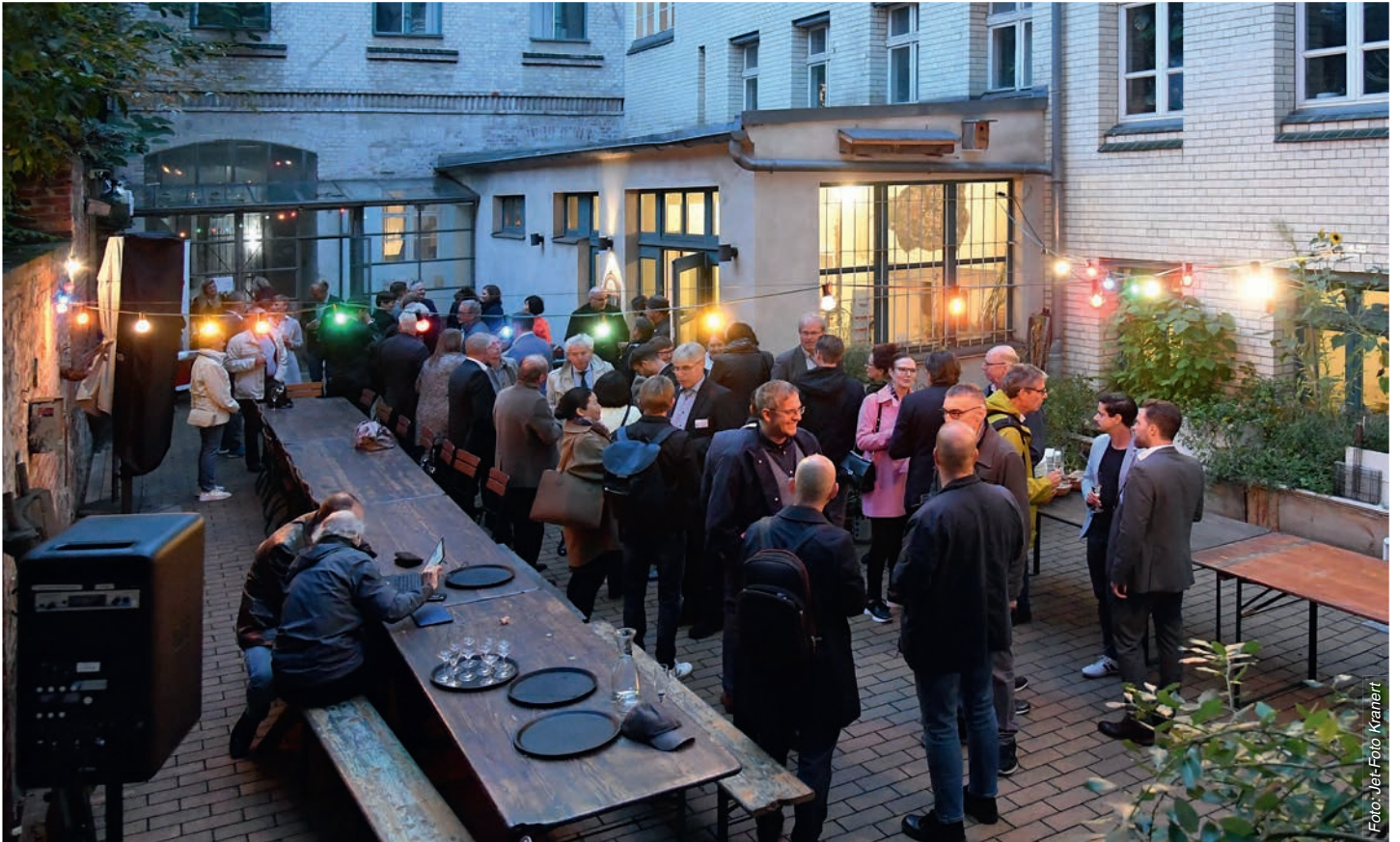
Freundliches Herbstwetter lädt zu einem Drink an der frischen Luft ein: Gäste auf dem BFV Haltepunkt