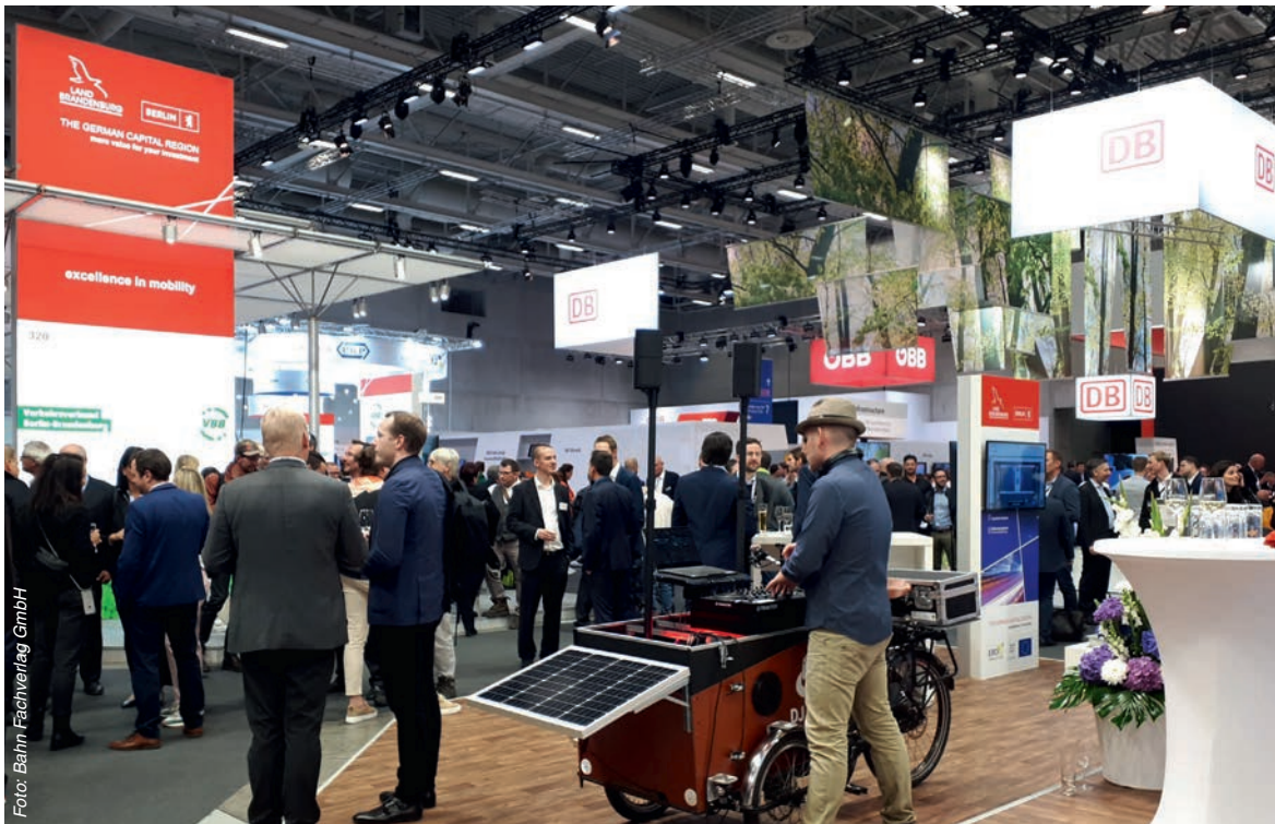
Nach einem langen Messetag darf auch gefeiert werden: Ein mobiler DJ sorgt für den passenden Sound beim Abendempfang der Wirtschaftsregion Berlin-Brandenburg