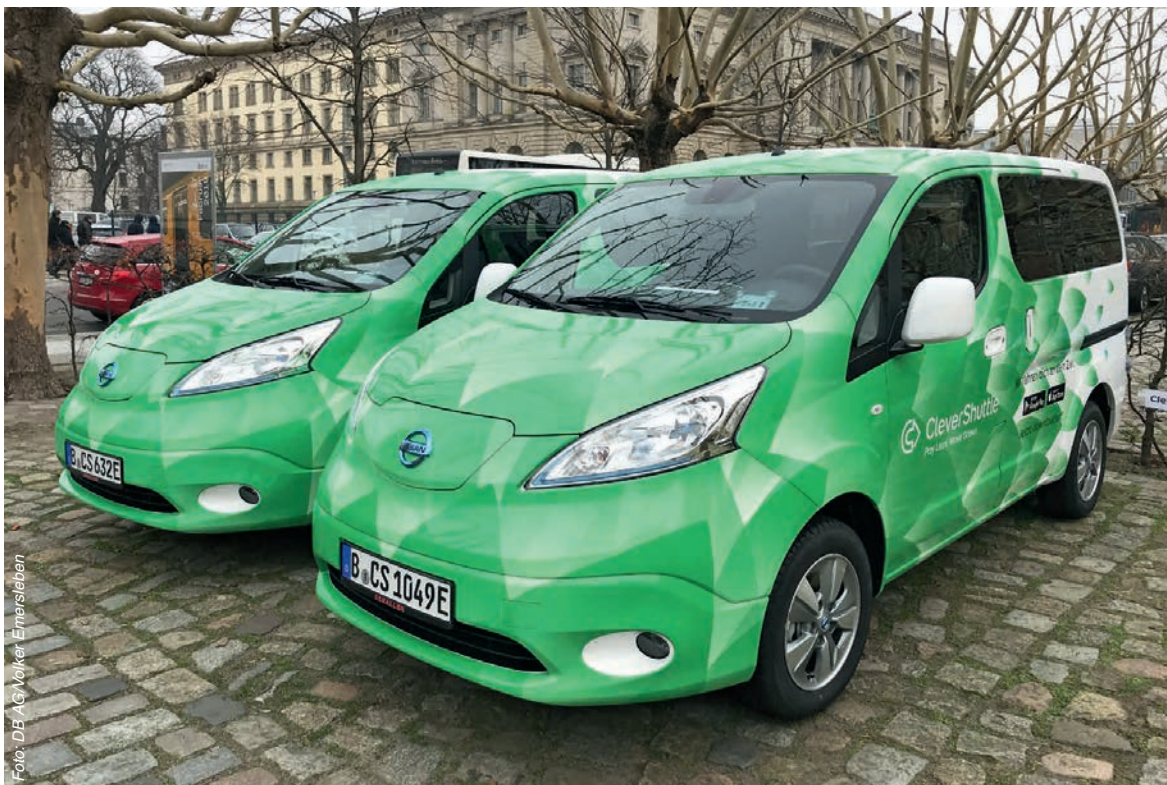
Der klassische Linierverkehr wird zunehmend mit bedarfsgesteuerten Angeboten wie Rufbussen und Sammeltaxis ergänzt

Angebotsformen sehen wir technik-gestützte Neuerungen. Der klassische Linierverkehr wird zunehmend mit bedarfsgesteuerten Angeboten, also beispielsweise Anrufsammeltaxis und Rufbussen ergänzt.