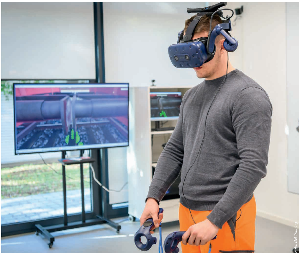
Azubi mit VR-Brille im TZ Köln-Dellbrück